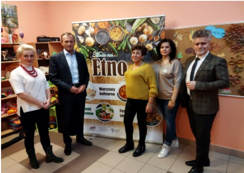
Projekt EtnoFit

z Piekoszowa”, którego działania polegają na promowaniu staropolskiej kuchni regionalnej i łączeniu tego, co tradycyjne ze zdrowym odżywianiem. W spotkaniu inauguracyjnym uczestniczył również senator RP - Krzysztof Słoń. Kolejnymi działaniami ujętymi w ramach projektu były warsztaty „Etnofit na talerzu”, które przeprowadzili profesjonalni kucharze.