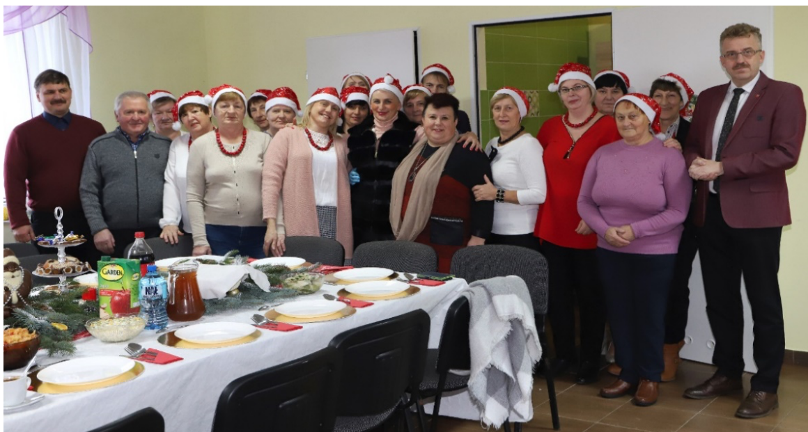
Spotkanie Wigilijne w Sworzycach