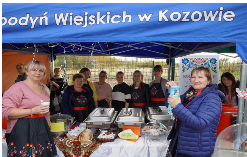
Festyn charytatywny w Kozowie