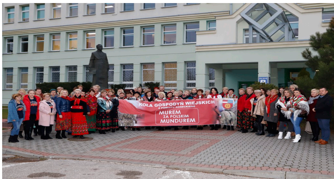
Akcja „Murem za Polskim Mundurem”