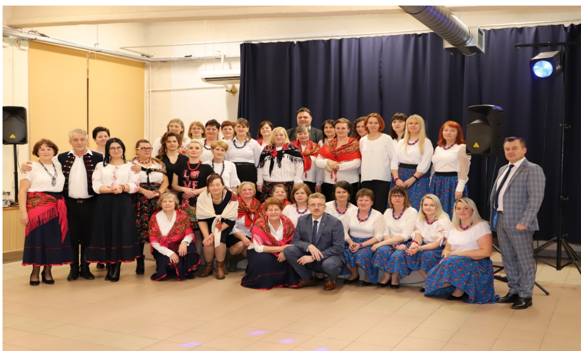
Powiatowy Przegląd Kół Gospodyń Wiejskich „Powiat ze Smakiem”

W spotkaniu założycielskim Powiatowej Rady KGW, które miało miejsce w sobotę 20 czerwca 2020 r. na terenie Zabytkowego Zakładu Hutniczego w Maleńcu spotkały się przedstawicielki 20 Kół Gospodyń Wiejskich z powiatu koneckiego. Po